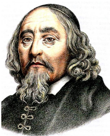
Рисунок 1 – Я.А. Коменский